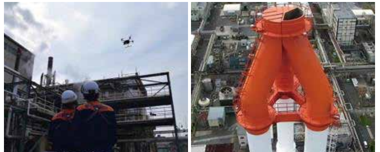
(株)ENEOS マテリアル・JSR(株)

一方で、企業側としては、大規模な災害時等における安全な情報収集の手段や定期的なメンテナンスへの活用を模索するなど、企業と行政が連携した活動を実施しています。