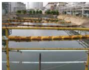
排水を処理する装置 （コスモ石油㈱）