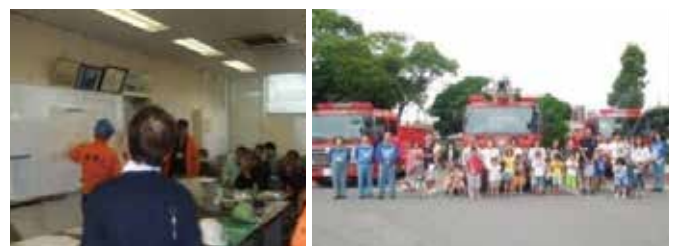
合同訓練や家族見学会の様子（コスモ石油(株)）