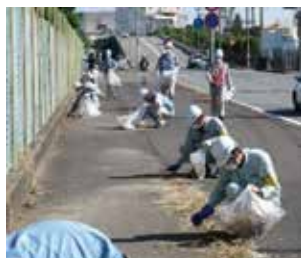
工場周辺の清掃活動 (三菱ガス化学株)