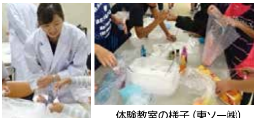
体験教室の様子（東ソー(株)）