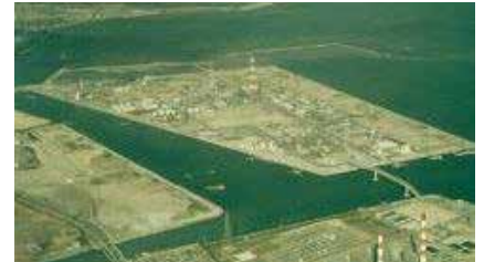
③操業当初の新大協和石油化学(株)(現 東ソー)