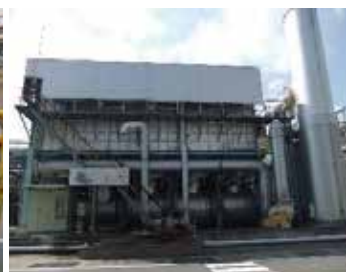
蓄熱燃焼式排ガス処理施設 （㈱ENEOS マテリアル）