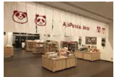
体験型の工場見学が可能（味の素(株)）