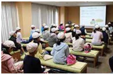
社会見学の様子（昭和四日市石油(株)）