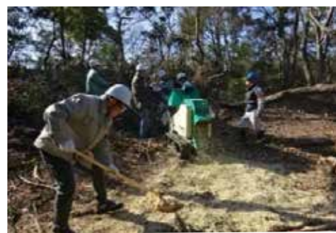
平成24年からKIEP'Sが実施している 里山保全活動（南部丘陵公園の常緑樹間伐）

定期的に里山の手入れを行うことにより、樹木の成長を促す日光が適時差し込み、森林を豊かにして生態系の維持に貢献しています。