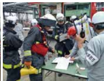
消防本部との連携訓練 (株)ENEOS マテリアル・JSR(株)