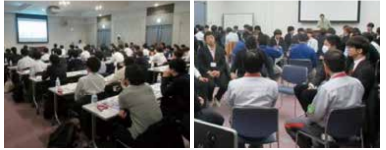
大学生を対象とした企業説明と工場見学（KHネオケム(株)他）

2010年からコンビナート事業所、三重大学、市が中心となって、機械・電気工学系を専攻している学生むけに企業見学会を開催して、先輩社員との交流を通じて、将来の就職先の候補として興味・関心をもってもらう活動を実施しています。