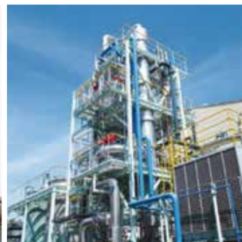
排水中のアンモニア低減を目的と したアンモニアストリッピング設備 （石原産業㈱）