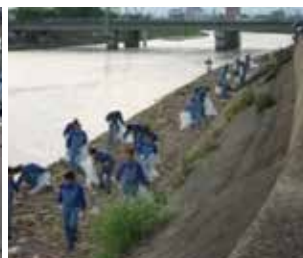
河川の清掃活動 (コスモ石油株)