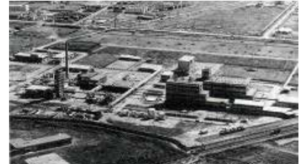
②1969(昭和44)年頃の味の素(株)東海事業所