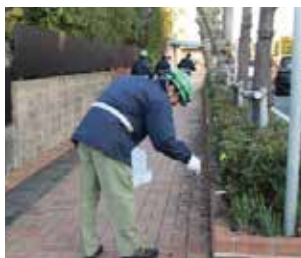
工場周辺の清掃活動 (昭和四日市石油株)

このような地域一体となった清掃活動を通じて、地域住民と顔の見える関係を構築しています。