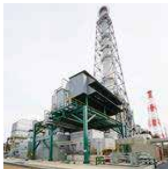
CO 2 排出を削減している ガスタービン（東ソー㈱）