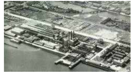
①昭和20年代の日本板硝子(株)四日市工場