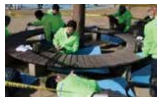
霞ヶ浦緑地公園のベンチ塗装 (KHネオケム株)

KHネオケム(株)四日市工場では、コンビナートに隣接する霞ヶ浦緑地公園の木製ベンチ等の塗装や新しくベンチを設置するなどして、公園を利用する市民の憩いの場を提供する活動を実施しています。