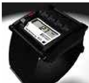
バイタルセンサー (味の素株)

バイタルセンサーは、働く従業員の体温・心拍・加速度(転倒)・位置情報などをリアルタイムでモニタリングすることができ、働く従業員の「安全と安心」に繋がっています。