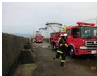
自衛消防隊との連携訓練 (コスモ石油株)